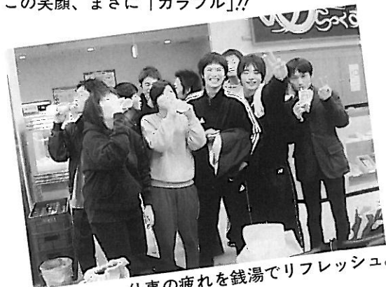
仕事の疲れを銭湯でリフレッシュ。心休まる一時。