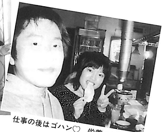
仕事の後はゴハン♡ 栄養…とってる？