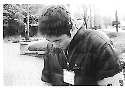
執行部の1日は気持ちの良い挨拶で始まります。