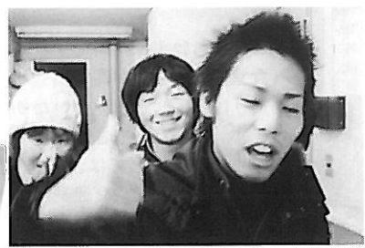
執行委員長の檄が飛ぶ。OK, Let's stand up!!