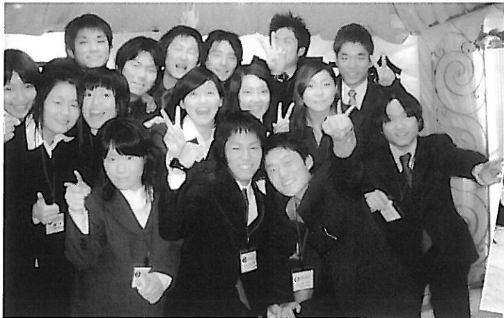
この笑顔、まさに「カラフル」!!