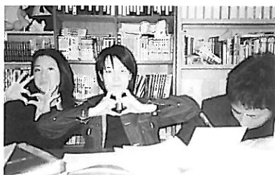
愛と勇気だけが友達…じゃないよ!!