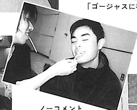
ノーコメント です。