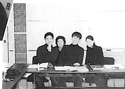
家族写真みたいですわね♪ で、どっちがパパ?