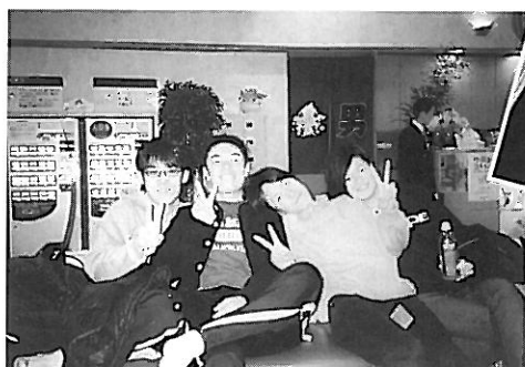
仕事の疲れをリフレッシュです。まったり♪