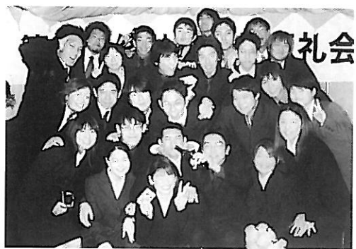
「ゴージャスに行こうぜ」 by 大橋!!