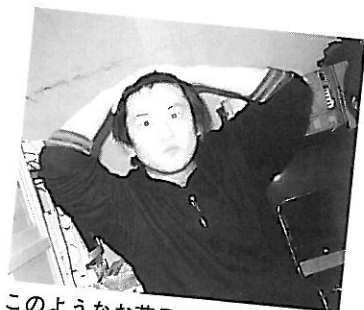
このようなお茶目さんがいます。(笑) わたしもこの写真はお気に入りです♡